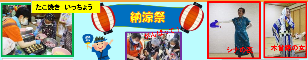
たこ焼き いっちょよ 納涼祭 屋食もご利用者様と一緒に料理しました ご利用者様による舞踊

ブログで行事の様子を紹介しています!! 詳細は下記URLからご覧ください!! http://www.shunkokai.jp